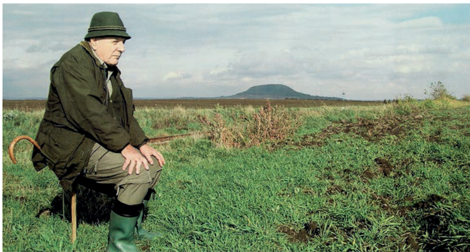
Pod horou Říp – vzácná návštěva na 69. ročníku MKP v Litoměřicích (2007).