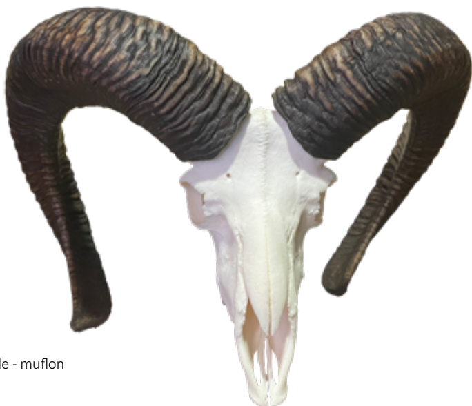
Úhyn Šubířov CIC 201,25 stříbrná medaile - muflon