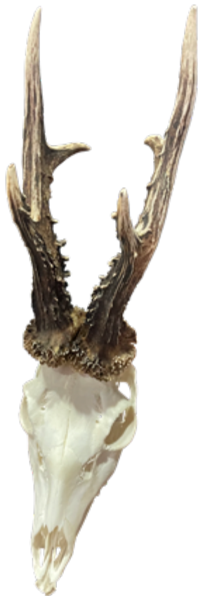
Úhyn Trstěnice CIC 117,42 stříbrná medaile - srnec