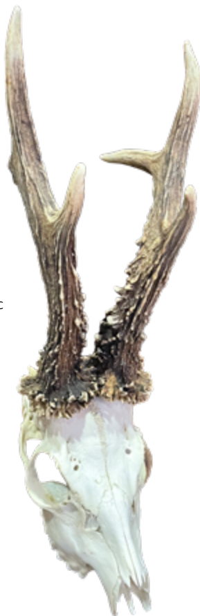
Úhyn Křenov CIC 120,87 stříbrná medaile - srnec