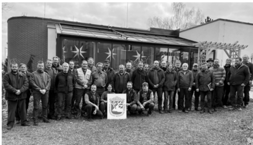
Foto členů hodnotitelské komise