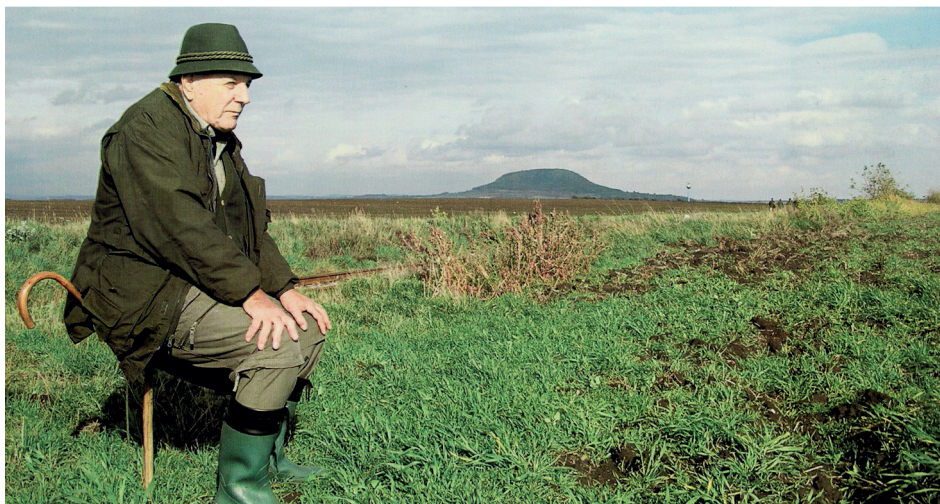
Pod horou Říp – vzácná návštěva na 69. ročníku MKP v Litoměřicích (2007).